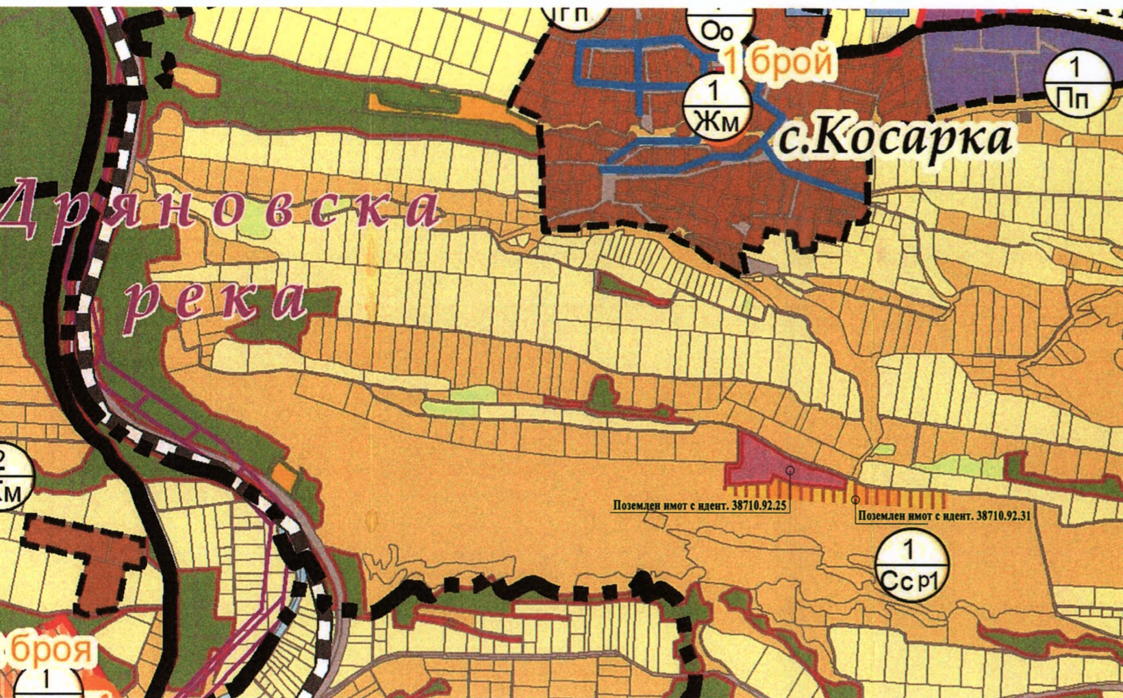
Опорен план - графична част към техническо задание М 1:1000